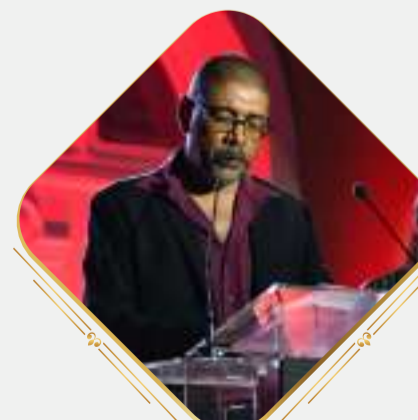
MÉRITO DESPORTIVO ALTO PRESTÍGIO Clube Sportivo Mindelense