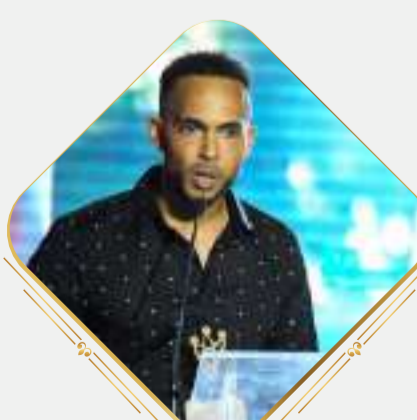
PRÉMIO CARREIRA Clube Ténis do Mindelo