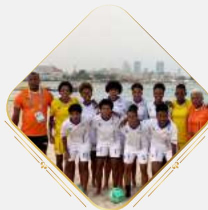
EQUIPA DO ANO Selec. Feminina de Futebol de Praia (Futebol)