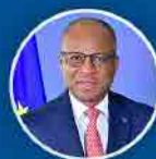
Ulisses Correia e Silva Primeiro Ministro