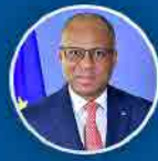
Ulisses Correia e Silva Primeiro Ministro

É nosso compromisso posicionar Cabo Verde como uma plataforma logística e marítima na atividade portuária, reparação naval, produção de energia limpa, pesca, aquacultura, biotecnologia azul, turismo e eventos náuticos internacionais.