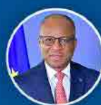
Ulisses Correia e Silva Primeiro Ministro

É um país bem posicionado nos rankings internacionais e regionais de boa governança, liberdades políticas e civis, democracia e cidadania, perceção de corrupção e transparência, liberdade de imprensa e liberdade económica.