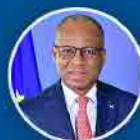
Ulisses Correia e Silva Primeiro Ministro

Temos tido mais criação de empresas por parte dos jovens e mais inscrição de empresas do regime REMPE no INPS.