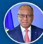
Ulisses Correia e Silva Primeiro Ministro

A Cidade da Praia irá ser dotada de um Centro de Convenções para posicionar a capital do país de forma competitiva no turismo de conferências, feiras e eventos culturais.