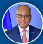
Ulisses Correia e Silva Primeiro Ministro

GOVERNO DE CABOVERDE A TRABALHAR PARA TODOS