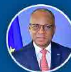
Ulisses Correia e Silva Primeiro Ministro