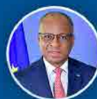
Ulisses Correia e Silva Primeiro Ministro

Em contexto difícil aumentámos o salário mínimo nacional e concedemos atualização salarial a funcionários da administração pública e a pensionistas do INPS.