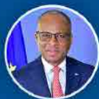
Ulisses Correia e Silva Primeiro Ministro

De 2005 a 2013, o OE foi congelando as promoções dos funcionários. A não realização de reclassificações, progressões, promoções e o não pagamento de subsídios pela governação anterior, provocaram elevados montantes que este governo tem estado a regularizar.