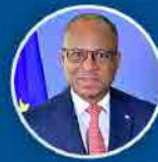
Ulisses Correia e Silva Primeiro Ministro

GOVERNO DE CABOVERDE A TRABALHAR PARA TODOS