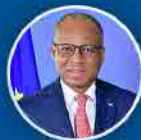
Ulisses Correia e Silva Primeiro Ministro

O empreendedorismo vai ser reforçado com o “ Banco Digital Jovem e Mulher ” e um novo pacote de formação profissional com reforço de kits para o primeiro emprego.