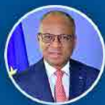
Ulisses Correia e Silva Primeiro Ministro

A Cidade da Praia irá ser dotada de um Centro de Convenções para posicionar a capital do país de forma competitiva no turismo de conferências, feiras e eventos culturais.