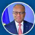
Ulisses Correia e Silva Primeiro Ministro

Cabo Verde lidera o Fórum dos Pequenos Estados no Banco Mundial e presidirá ao Conselho dos Governadores do Grupo Banco Mundial e Fundo Monetário Internacional em 2025.