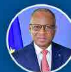
Ulisses Correia e Silva Primeiro Ministro