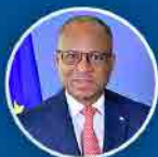
Ulisses Correia e Silva Primeiro Ministro

GOVERNO DE CABOVERDE A TRABALHAR PARA TODOS