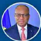
Ulisses Correia e Silva Primeiro Ministro

GOVERNO DE CABOVERDE A TRABALHAR PARA TODOS