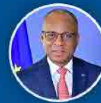
Ulisses Correia e Silva Primeiro Ministro

50% do Fundo do Turismo canalizado para o financiamento de projetos municipais de regeneração, requalificação e reabilitação urbana e ambiental de cidades, vilas e aldeias. Foram 5,3 milhões de contos no período 2017/2024.