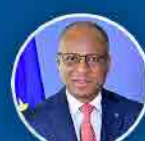
Ulisses Correia e Silva Primeiro Ministro

Como resultados da concessão de serviço público de transportes marítimos inter-ilhas, aumentaram as frequências, o número de passageiros e cargas transportados, regularidade e a previsibilidade das ligações.