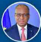
Ulisses Correia e Silva Primeiro Ministro

Em 2023, 368 mil pessoas eram beneficiadas com isenção da taxa moderadora de saúde.