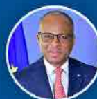
Ulisses Correia e Silva Primeiro Ministro

Estamos a implementar um sistema de gestão da Administração Pública muito melhor. Aplicámos um incremento de 2.000$00 em resultado do aumento de 3% do volume da massa salarial de 2023, concedido no OE 2024. São milhares de funcionários públicos beneficiados.